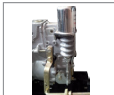
Sistema de protección