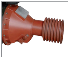
Embrague LOVOL 200 SAE#3