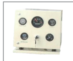
Panel de control analógico