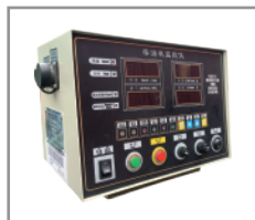
Panel de control digital con modo Local, Remoto y Autodiagnostico de seguridad