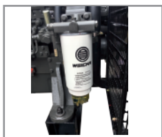
Sistema 3 etapas de filtración de combustible con separador de agua