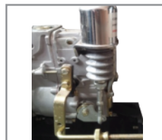
Sistema de protección 4 puntos