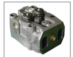
Cabezotes individuales con ángulo de inyección de baja inercia.