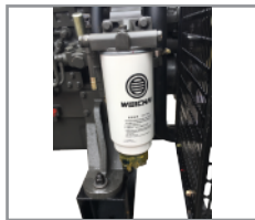
Sistema 3 etapas de filtración de combustible con separador de agua