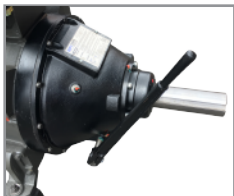
Embrague WPL314 sin ruliman piloto SAE#1 triple disco