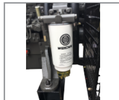
Sistema 3 etapas de filtración de combustible con separador de agua