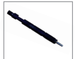
Inyector baja inercia