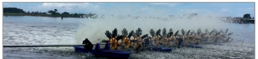
ZUZU es el especialista global en equipos de aireación para Acuicultura