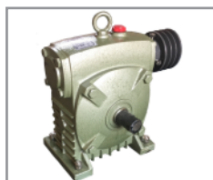
Reductor Severe Duty Reforzado