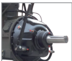
Embrague WPT SAE#3 Sin ruliman Piloto