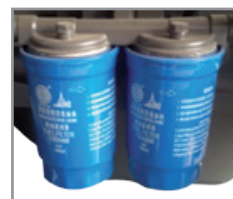
Sistema de doble filtro de combustible