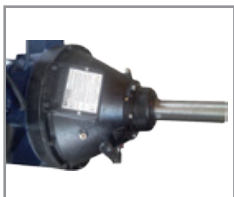
Embrague WPT SAE#1