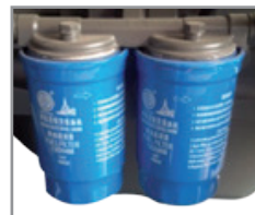
Sistema de doble filtro de combustible