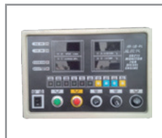
Panel de control digital con modo Local, Remoto y Autodiagnostico de seguridad