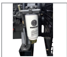
Sistema 3 etapas de filtración de combustible con separador de agua