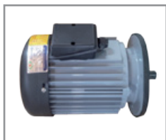
Potente motor eléctrico con impermeabilización IP54 y marco #90 Bobina con Alambre de cobre.