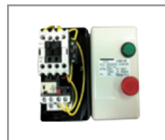
Incluye arrancador TECO HUEB-16K con breaker magnético, con protección de variación de carga y fuga eléctrica. (distancia máxima de instalación 100m)