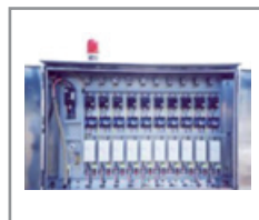
Operatividad sencilla y centralizada. *Opcional panel de control automático, no incluido.